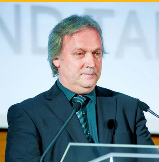
PROF. DR. FREUND TAMÁS

BORÁSZOK BARÁTJA 2017 Főiskolai docens, a BorSchola alapítója és tanára, szakíró